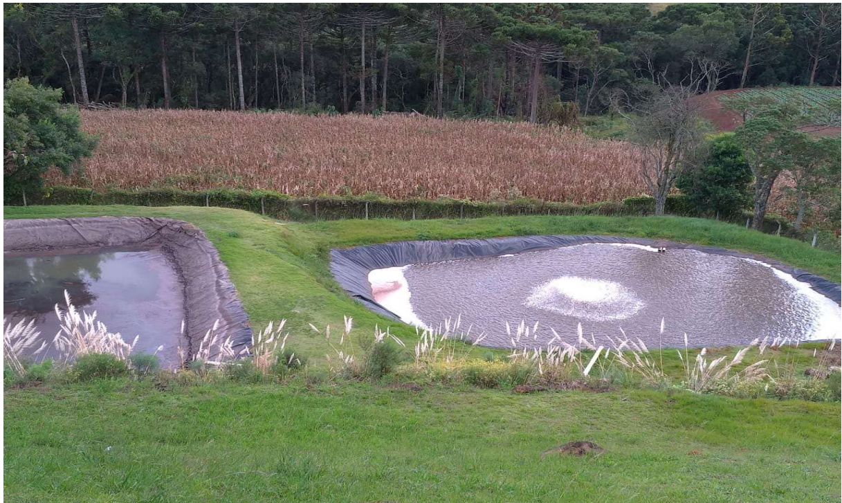
Figura 2 – Sistema de aeração instalado.

As amostras foram coletadas semestralmente nos anos de 2016 a 2018 - sendo que o sistema de aeração foi instalado no segundo semestre de 2018, em vidros previamente limpos, conforme NBR 9898 (ABNT, 1987), na saída do sistema de tratamento, após a coleta as amostras foram encaminhadas ao Laboratório de Análises Ambientais da Terranálise, localizado no município de Fraiburgo, Santa Catarina. Para o desenvolvimento do monitoramento foi analisado os parâmetros de pH, temperatura, materiais sedimentáveis, óleos minerais, DBO, DQO, chumbo total, cobre total, cromo hexavalente, cromo trivalente, ferro dissolvido, manganês dissolvido, sulfeto, zinco total, substâncias tensoativas que reagem ao azul de metileno e oxigênio dissolvido (APHA, 2005). Para avaliar a eficiência do sistema de tratamento de aeração, foi dimensionado um sistema de aeração, buscando melhorar o sistema de tratamento biológico da empresa em outubro de 2018. O presente estudo tem como base cumprir o estabelecido pela Resolução CONAMA (RC) 420/2009 e Lei Estadual (LE) 14.675/2009.