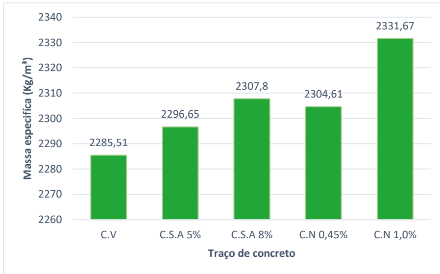
Gráfico 5: Massa específica dos traços de concreto

Para determinação da massa específica do concreto, foi seguido o ensaio descrito na NBR NM 9833 (ABNT, 2009), logo em seguida, foi elaborado o Gráfico 02.