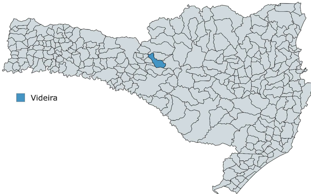
Figura 1 – Localização geográfica de Videira, Santa Catarina, município de origem da amostra.