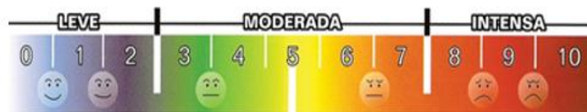
Figura 1. Escala Visual Analógica de Dor (EVA).

O instrumento utilizado na coleta de dados para avaliação da intensidade da dor foi a escala visual analógica - EVA (MARTINEZ; GRASSI; MARQUES, 2011), a qual avalia a intensidade do quadro algico numa escala visual simbólica sugestiva com escores de dor que variam de 0 a 10 (figura 1). Também foi utilizado um questionário para avaliação de dor, tendo como objetivo a identificação do paciente, obtendo a coleta de dados para avaliar e tratar os distúrbios musculoesqueléticos. Nesse cenário foi possível verificar a evolução do quadro algico que o paciente apresentava antes e após o tratamento com a aplicação dos protocolos de auriculoterapia.